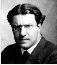
Rabbi Stephen Wise