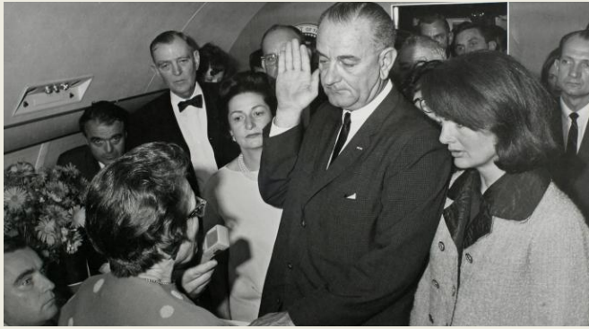
Johnson became President of USA