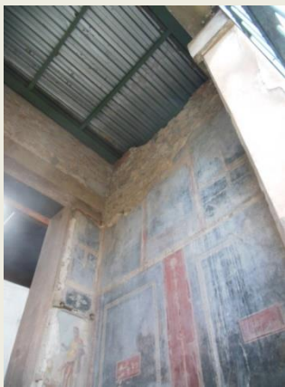
庞贝城-在石墙上贴仿古壁画