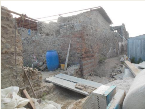
庞贝城-建筑工地里

http://blog.sina.cn/dpool/blog/s/blog_4b712d230102wvpq.html?type=-1