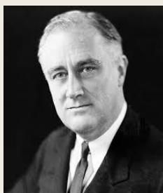
Franklin D. Roosevelt

-在这里，我们不是说美国攻打日本不对，更加不是说日本侵略中国是对。我们想表示的是：一切都是美国安排好的。