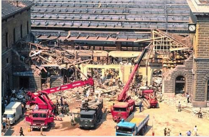
Bologna massacre 1980