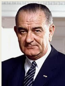
Lyndon B. Johnson

-约翰逊总统更在 1967 年 6 月 8 日，美国中东侦察船 U.S.S. Liberty 号被以色列攻击时，下令美国航空母舰的飞机不准支持。他说宁愿侦察船沉没，也不想令他的以色列朋友尴尬（prefer the ship go to the bottom rather than embarrass Israel）