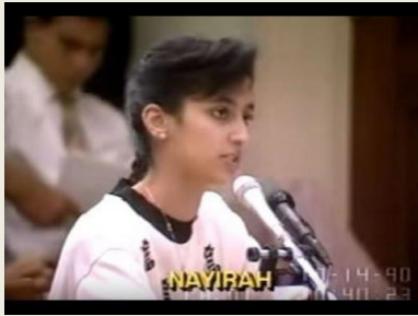
Nayirah - 另一个大话精

https://www.youtube.com/watch?v=LmfVs3WaE9Y&t=84s