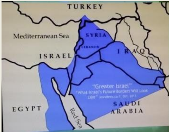
Yinon Plan，大以色列(土地包括巴勒斯坦/黎巴嫩/叙利亚/伊拉克/沙地阿拉伯/埃及)