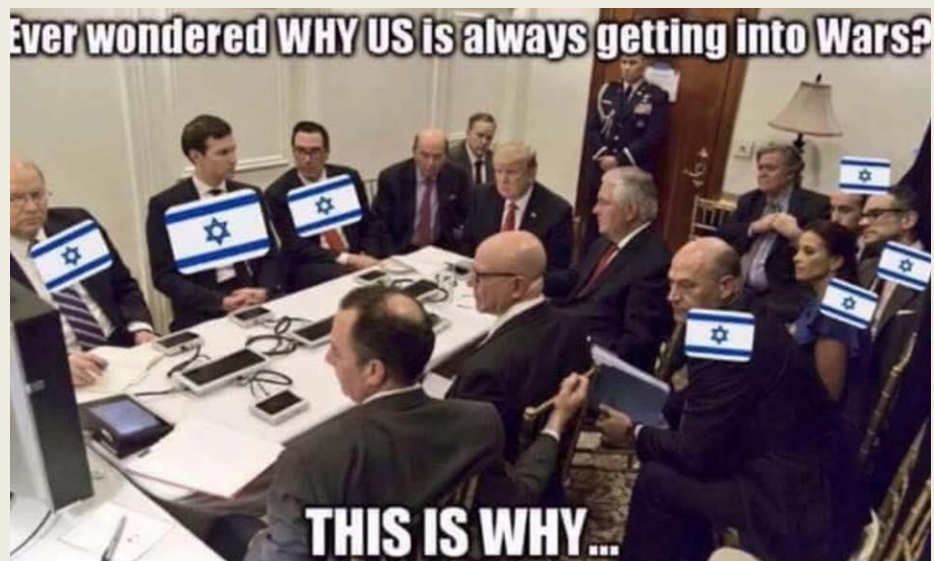
特朗普政府里面的犹太人