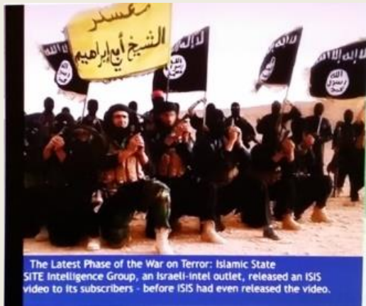
The Latest Phase of the War on Terror: Islamic State SITE Intelligence Group, an Israeli-intel outlet, released an ISIS video to its subscribers - before ISIS had even released the video.